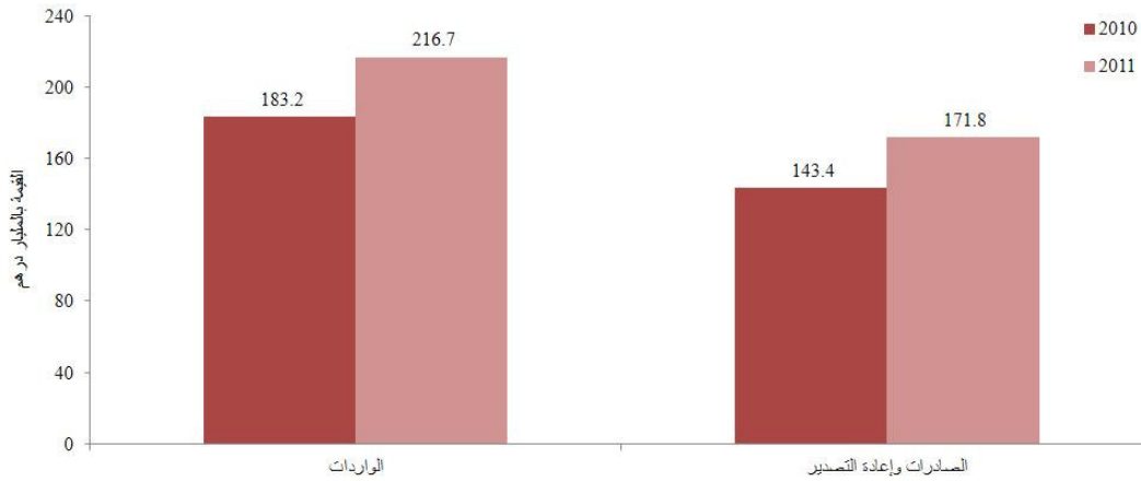
شكل (2) | تجارة المناطق الحرة والمستودعات الجمركية 2010 - 2011